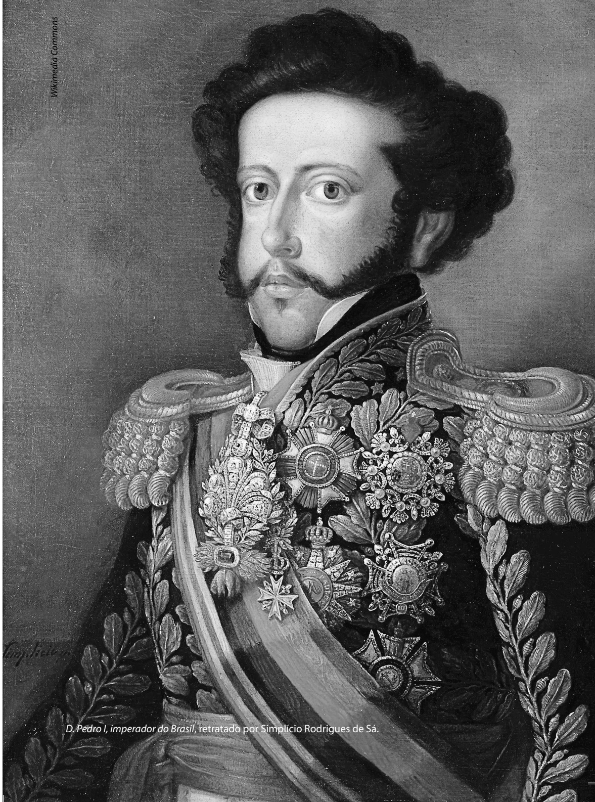
D. Pedro I, imperador do Brasil, retratado por Simplicio Rodrigues de Sá.