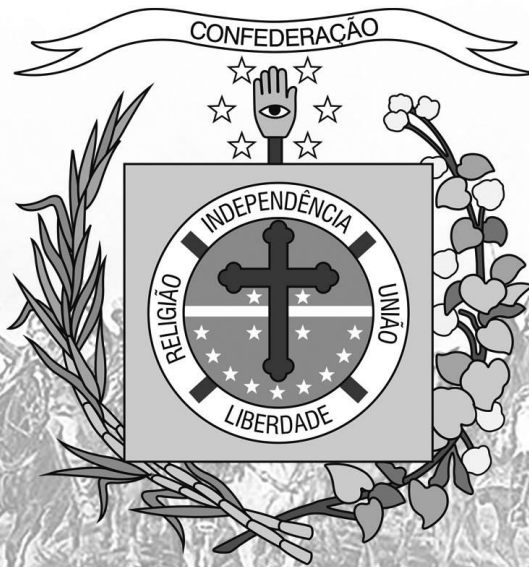
Brasão da Confederação do Equador. Ao fundo Independência ou morte , tela de Pedro Américo.