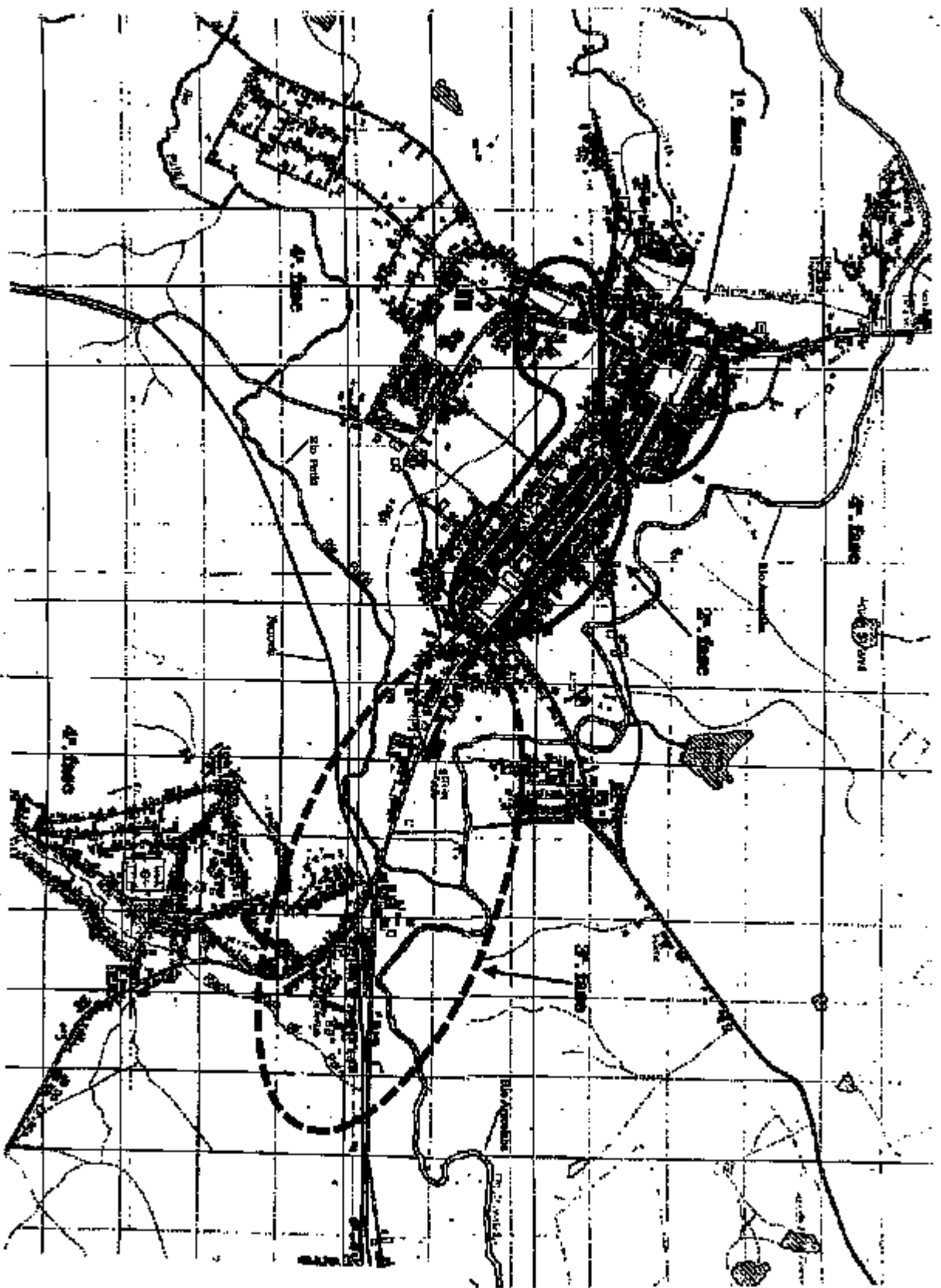
Figura 3 - Cidade de Baturité. Passos do desenvolvimento urbano. (Perímetros aproximados). Levantamento gráfico - Secretaria Estadual de Desenvolvimento Urbano, 1997.