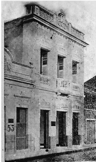
Predio onde funciona o Banco dos Importadores

capital social de 200 contos de réis, assim distribuído entre os sócios: Ribeiro (50 contos) e Barbosa (150 contos) (SUCEC, 1926).