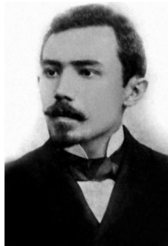
Figura 1 – Ildefonso Augusto Lacerda Leite (Lavras – CE, 08/01/1876 – Princesa – PB, 06/01/1902).

Doutorou-se pela Faculdade de Medicina do Rio de Janeiro, em 12 de janeiro de 1900, com a tese “ Ensaio de philosophia natural ” (Leite, 1900).