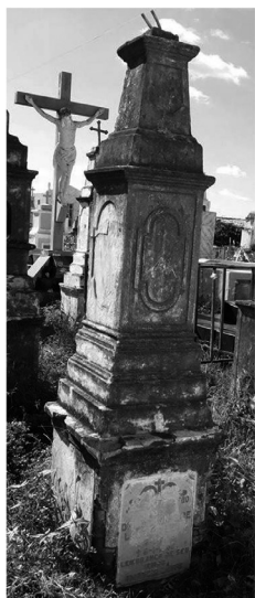
Figura 10 – Túmulo de Ildefonso Augusto Lacerda Leite, no cemitério de Lavras (CE), mandado construir pelo irmão Amâncio Lacerda Leite.